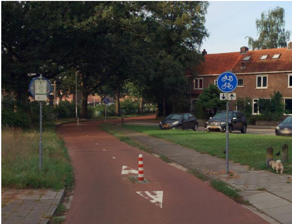
Voorbeeld van een afsluiting op de Hatertseveldweg.

Een afsluiting op de Winkelsteegseweg. Dat is de hoofdweg tussen de Edelstenenbuurt en de Winkelsteeg.