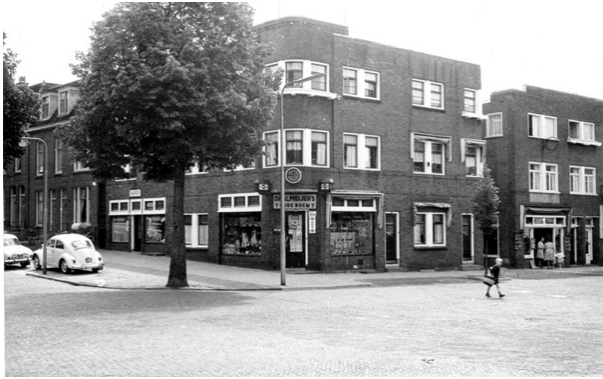
Figuur 1 De Hommelseweg 290

achtcilinder Amerikaanse Galaxy Ford naar Arnhem om zijn ouders te bezoeken. Elke zondag weer. Of op zaterdag, zoals mijn broers en zussen mij memoreerden.